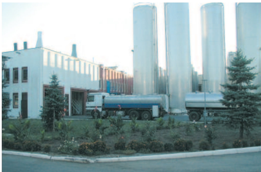
Milchannahme im Milchkombinat Timashevsk

Was 1992 mit einer einzigen Produktionslinie in Moskau begann, ist heute ein Unternehmen mit Weltruf: Wim-Bill-Dann, deren Aktien seit dem Jahr 2002 auch an der New Yorker Börse gehan-