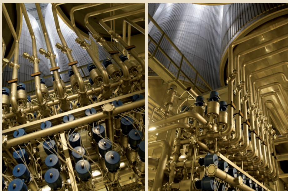
Abb. 3 Gär- und Lagerkeller mit Ventilknoten

brewmaxx V8 schafft mit seinen Funktionsmodulen eine durchgängige Daten-, Informations- und Kommunikationsstruktur von der Prozessebene mit Sensoren, Armaturen, Motoren, Pumpen über die MES-Ebene (Manufacturing Execution System) mit Betriebsdaten-, Maschinendatenerfassung, Leitstand und Anlagensteuerung bis hin zum überlagerten ERP-System (Enterprise Resource Planning). Mit brewmaxx V8 ist eine echte Materialwirtschaft im Braubereich möglich. Das in brewmaxx V8 integrierte Materialwirtschaftsmodul bindet die internen Materialbewegungen an die Prozessleitebene der Brauerei an und stellt in der Produktion eine durchgängige Rückverfolgbarkeit vom Drucktank bis zum Malzsilo sicher.