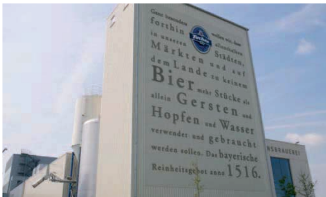
Das Reinheitsgebot könnte Tucher mit gutem Gewissen mit einem Energiespargebot vervollständigen.